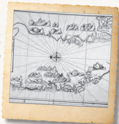
1724 von Hans Egede erstellte Karte von Westgrönland

Hans Egede richtet sein Augenmerk darum vermehrt auf Kinder und junge Leute. Er und seine Frau nehmen zwei einheimische Jungen in ihren Haushalt auf und lehren sie lesen. Paul, der älteste Sohn der Egedes, malt Bilder, um seinen Freunden die biblischen Geschichten näherzubringen.