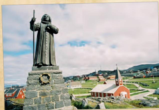
Hans-Egede-Statue in Nuuk, Grönland