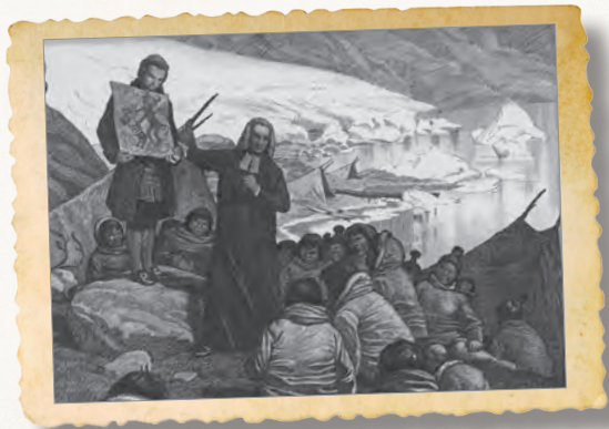
Hans Egede in Grönland, Lithografie von Louis Moe (1898)